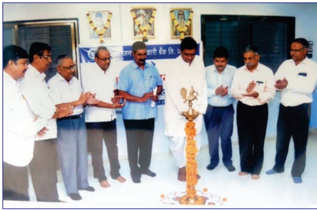
बँकेच्या धुळे येथील देवपूर शाखा नूतन वास्तु स्थलांतर प्रसंगी दीपप्रज्वलन करतांना मान्यवर