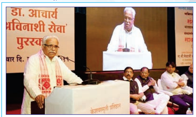
डॉ.आचार्य अविनाशी सेवा पुरस्कार कार्यक्रम प्रसंगी मनोगत व्यक्त करतांना राष्ट्रीय स्वयंसेवक संघाचे सरकार्यवाह मा.भैय्याजी जोशी.