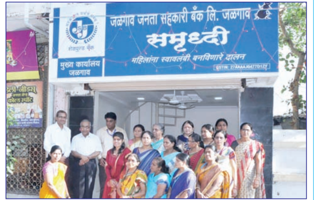
बँकेमार्फत महिला बचत गटांचे उत्पादन विक्री करण्यासाठी बाजार पेठ उपलब्ध करून देण्याच्या अनुषंगाने बँकेच्या मुख्य कार्यालय परिसरातील बँकेच्या मालकीचे दुकान बचत गटांना त्यांचे उत्पादन विक्री करण्यासाठी विनामूल्य उपलब्ध करून देण्यात आले आहे